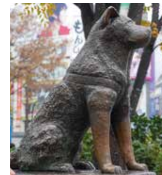
Die Statue von Hachiko bei der Shibuya Station in Tokio.

Hachiko war ein Shiba, eine der ältesten japanischen Hunderassen. Es sieht ein wenig wie ein Fuchs, kann aber auch Ähnlichkeiten zu einer Katze zeigen. Er ist sehr unabhängig, äußerst loyal und sehr freundlich zu seiner Familie.